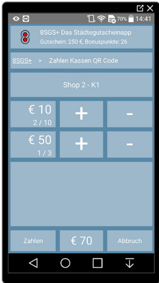
Zahlen mit Gutscheinen

Der Zahlungsvorgang mit Gutscheinen gestaltet sich folgendermaßen: